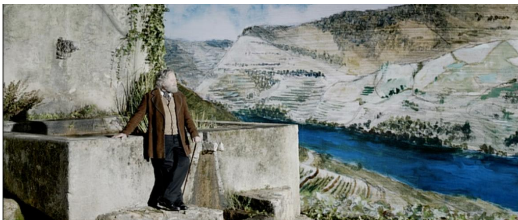
Figura 1 – Afonso da Maia na quinta de Santa Olávia, no Douro.