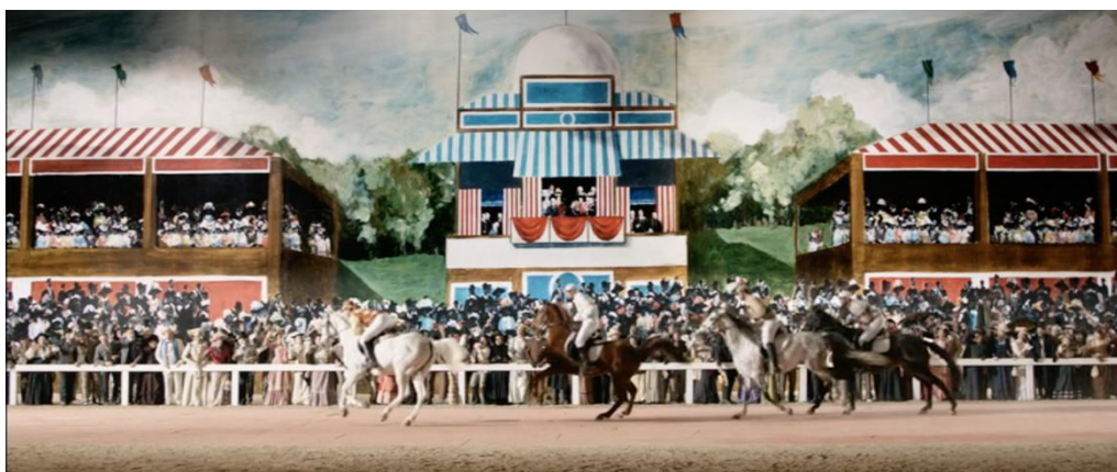
Figura 6 – As corridas de cavalos no hipódromo.