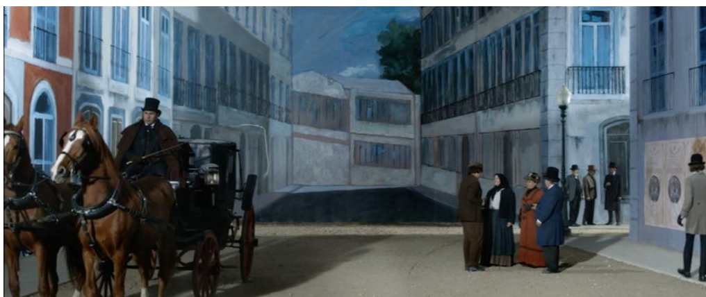
Figura 7 – As ruas da cidade de Lisboa.