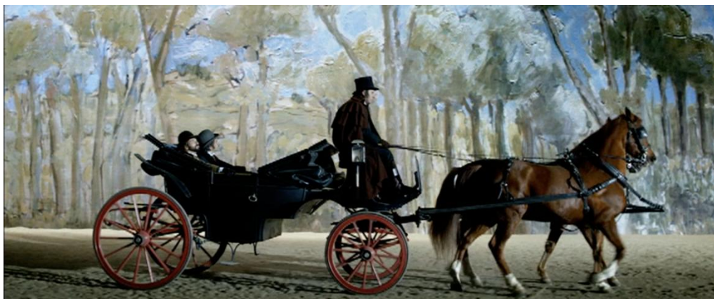
Figura 4 – Ida de Carlos e Cruges a Sintra.