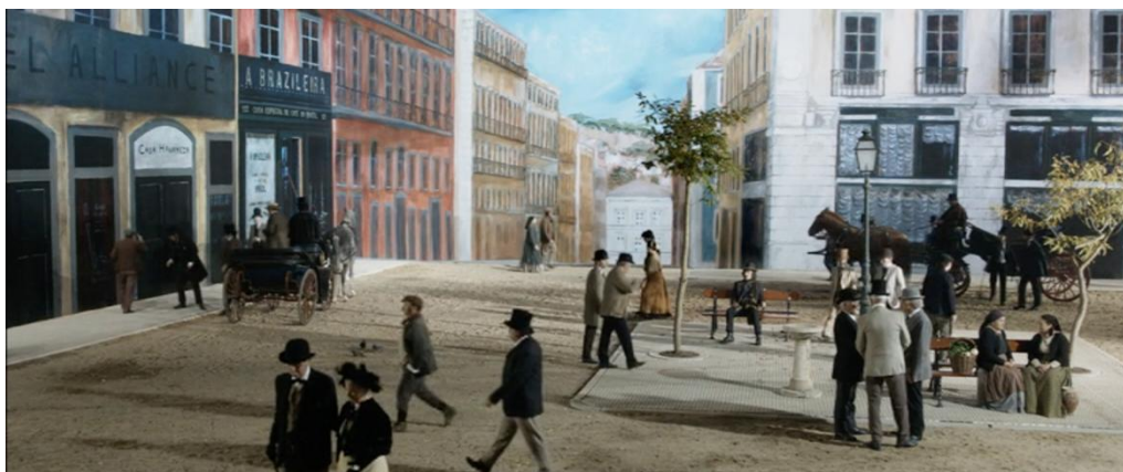
Figura 8 – Praceta de convívio e vida social lisboeta.