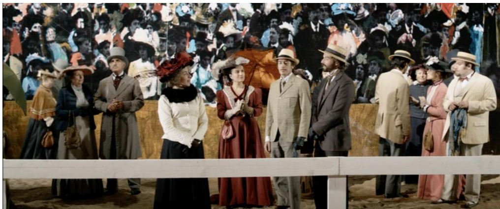
Figura 5 – Convívio da alta sociedade nas corridas do hipódromo.