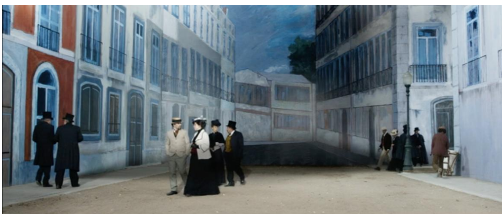
Figura 2 – Ruas e edifícios da cidade de Lisboa, no séc. XIX.