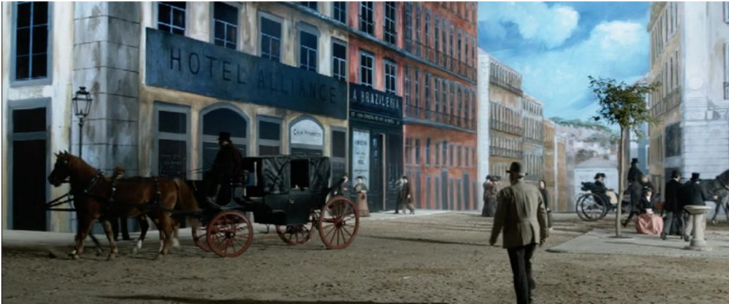
Figura 9 – Representação do “Hotel Alliance” e do café “A Brasileira”.