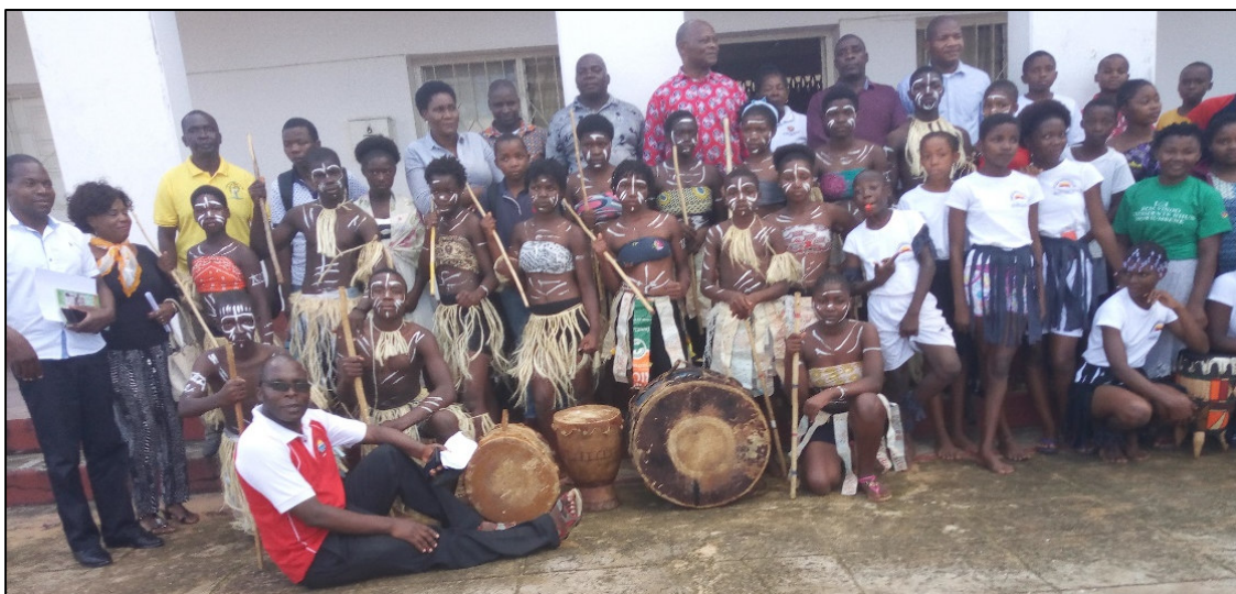
Fig. 5 – Foto de família com o Excelentíssimo Senhor Administrador depois de ocuparmos o primeiro lugar no Festival Distrital de Xigubo.

Considerando o interesse histórico-cultural desta manifestação da arte da região, importa reforçar o seu conhecimento e prática por forma a preservar as danças tradicionais que estão em via de extinção. A Escola Secundária de Cambine, entre os Cursos de Curta Duração planificados, introduziu o curso de danças tradicionais, que contempla o ensino de Xigubo, propondo a sua implementação, com vista a desenvolver nos seus alunos as competências do saber fazer e, também, com vista a valorizar a coexistência dialógica das diversas etnias que aí se relacionam.