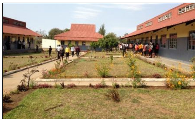
Fig. 2 – Vista frontal da Escola Secundaria de Cambine.