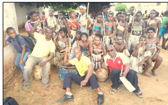
Fig. 3 e Fig. 4 - Diversidade da cultura na dança.